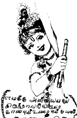
ராமகீத அண்ணியமாவு கிழந்தொலிவியே காண்புதிட்டை உயிர் உயிர்